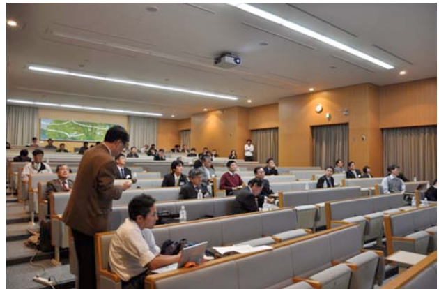
Participants in Katsura Hall