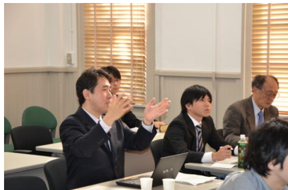
Discussion in seminar