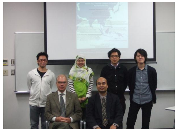
Speakers from the Seminar on March 25, 2010

初めに、Kennett 教授が 45 分間「地震波トモグラフィ」という題目で講義を行った後、環境資源システム工学研究室の 5 人の発表が約 2 時間行われ