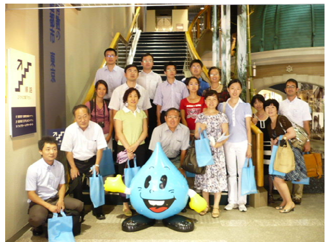
All of the participants of this seminar