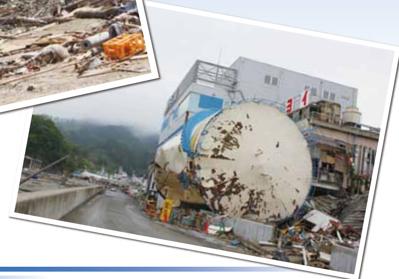
Damaged fuel storage tank in Kesennuma City (May 22, 2011)