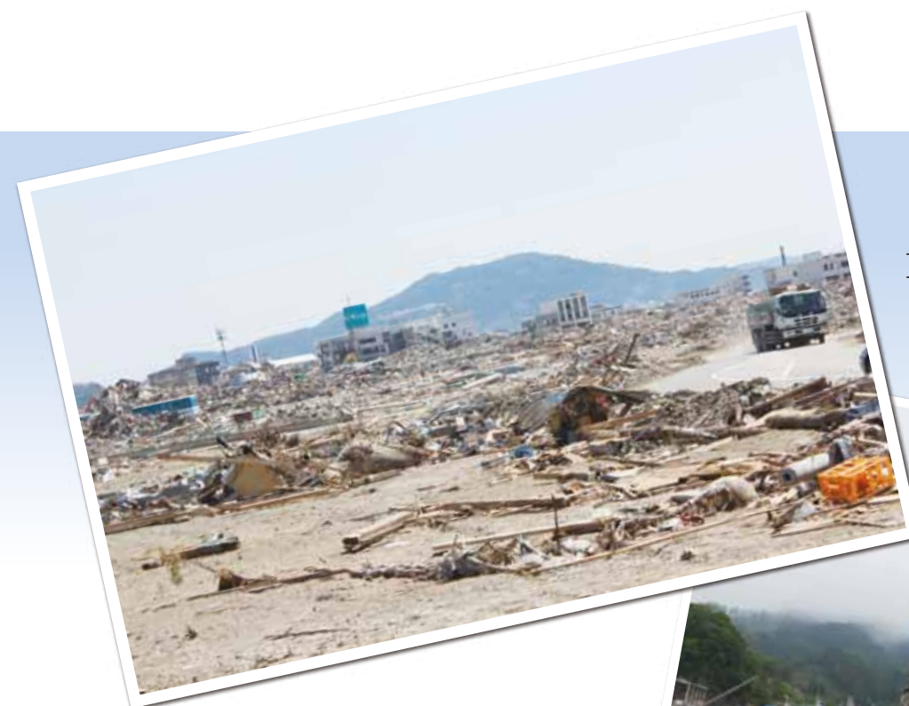
Tsunami devastated area in Rikuzen Takada City (April 18, 2011)